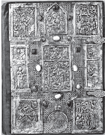
Рис. 1. Серебряный оклад Евангелия из сольвычегодского Благовещенского собора. Начало XVII в. Сольвычегодск. ММК

Верхняя и нижняя деревянные крышки переплета книги обиты темно-красным бархатом. Верхняя крышка украшена серебряным басменным окладом с «сетчатым» узором в виде повторяющихся мелких четырехконечных крестиков. Здесь же крепятся 9 басменных дробниц с лицевыми изображениями (7 – прямоугольных, 1 – в виде киотца с килевидным верхом и 1 – круглая), а также 15 кабошонов камней и перламутровых плашек в оправках 2 .