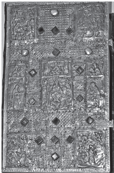
Рис. 2. Серебряный оклад Евангелия из храма Воздвижения в Орле-городке в Пермском крае. 1603 г. Сольвычегодск. ПГХГ