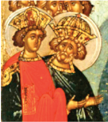
Ил. 2. Царь Давид изображен анфас и смотрит прямо на зрителя (редкое визуальное решение).

ному статусу или социальному положению. «Старейшина»-правитель может быть (относительно) молодым человеком. Духовных наставников из числа монахов называют «старцами» независимо от реального возраста. Это часто отображается в иконографии. Если святой стал монахом или пустынником в юности, борода может возникнуть у него именно в этот момент (аскеза – путь зрелого подвига). В этом контексте появление бороды (реже – согбенной спины 9 ) обозначает духовное, а не биологическое взросление. Если человек был книжником, мудрецом, наставником, священником, в большинстве случаев он также получит этот атрибут.