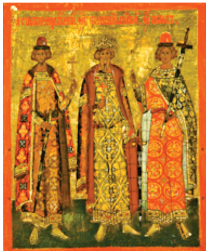
Ил. 1. Борода как маркер возраста/старшинства:

заметить даже на крошечных фигурках, когда волхвы изображались конными в углу композиции. Так же отмечали возраст на иконах, где Борис и Глеб изображались вместе с их отцом, князем Владимиром. Великий князь, отец братьев-страстотерпцев, занимает центральную позицию, а его удлиненная борода указывает на старейшинство (во всех смыслах). Борис стоит по правую руку от отца и носит небольшую темную бороду; младший Глеб – безбородая фигура по левую руку от Владимира.