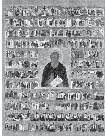
Ил. 1. Икона «Преподобный Александр Свирский, с житием в 129 клеймах», середина XVI в., из Успенского собора Московского Кремля, ММК

с текстом сложно не заметить – мастер включает в каждое клеймо фрагменты литературного источника, делая надписи в несколько строк. С другой стороны, в основе изобразительного цикла лежит художественный замысел, предполагающий оформление разнообразных, пусть и выстроенных по хронологии сцен в общую композицию. Особенность организации цикла состоит в том, что после четырех верхних рядов клейм повествование продолжается сначала в правой, а затем – в левой части обрамления. Зрительно это не улавливается, а объяснить такой принцип распределения сюжетов затруднительно. Можно было бы предположить, что мастер хотел показать таким образом определенные части жития в виде автономных циклов, однако водораздел между разными фазами жизни преподобного внутри общего повествования не совпадает с границами левой и правой частей иконы 16 . При этом на уровне средника с «портретом» святого размещаются наиболее важные события его жизни, известные в иконописи второй половины XVI–XVII в. и как