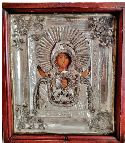
Ил. 1. Вологодская икона-киотка, конец XIX в. Для создания оклада мастерицы выбирали гальванированную фольгу разных типов – посеребрённую, золоченую или фольгу, окрашенную под золото. Богоматерь Знамение, фольговая икона-киотка, рубеж XIX–XX вв.

Аналогичные приемы были характерны для вологодских икон. Тот же бисер и бусины (включая специфические, качественные, поставляемые из-за рубежа), тот же трунцал, те же окантовки фигур и нимбов. Точно так же опорным элементом икон оказывались крупные элементы в четырех углах киотки. Однако вместо цветов вологодские мастера помещали туда специфические «веточки», которые мы опишем ниже (ил. 1, 2).