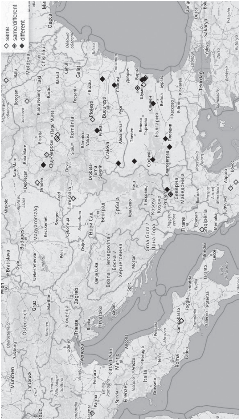
Карта 3. Тождественность каритивного показателя с именной и глагольной группами